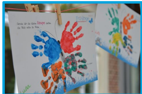
Gerade als die Raupe dachte die Welt wäre zu Ende, verwandelte sie sich in einen Schmetterling.

In Bielefeld konnten wir mehrere Spielmöglichkeiten wie z.B. das gespendete Wurfspiel " Raupe Nimmersatt " anbieten. Vor allem unser Schmetterling-Bastelangebot ist von den Besuchern sehr gut angenommen worden.